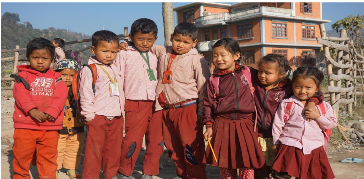
Schoolkinderen in Dhandkhola

40 Schoolkinderen van de armste ouders worden vanuit Nederland financieel geadopteerd waardoor zij gratis naar school kunnen en aan wie een gezonde lunch wordt verstrekt. Er staan nog 4 kinderen op de wachtlijst!